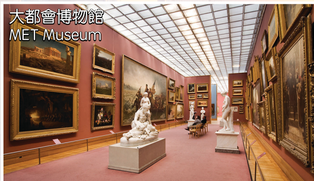
大都會博物館 MET Museum

酒店: Crowne(或Ramada) Plaza/Sheraton/Hilton /Courtyard by Marriott 或同級