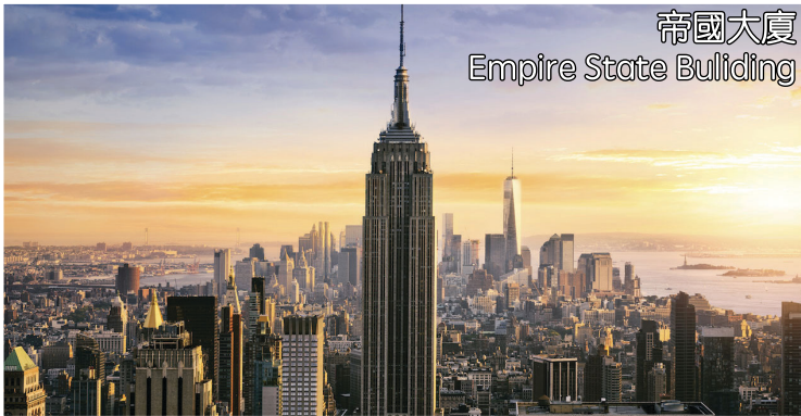
帝國大廈 Empire State Building