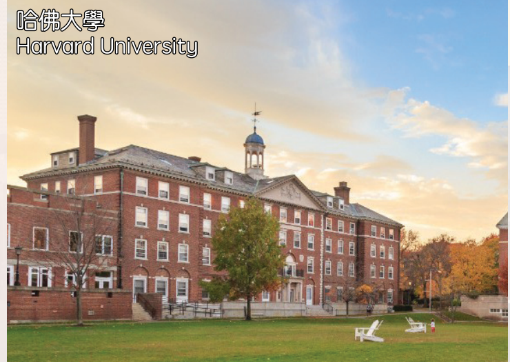
哈佛大學 Harvard University