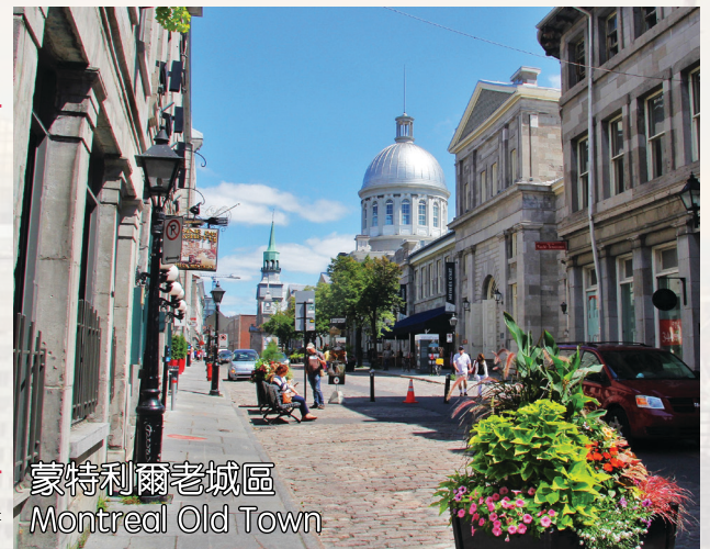
蒙特利爾老城區 Montreal Old Town

Boston city tour included: Mother Church, taking photos with Trinity Church of Boston and John Hancock Tower. Take Boston Harbor cruise with sightseeing of the city and visit the historical Quincy Market.