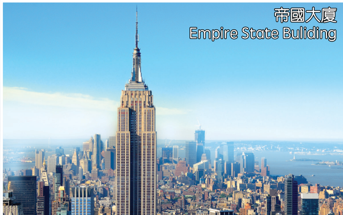
帝國大廈 Empire State Building