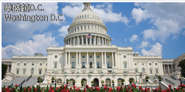
華盛頓D.C. Washington D.C

酒店: Crowne(Ramada) Plaza/Sheraton/Hilton/Courtyard by Marriott 或同級