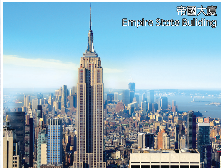
帝國大廈 Empire State Building

豪華酒店: Crowne(或Ramada) Plaza/Sheraton/Hilton /Courtyard by Marriott 或同級