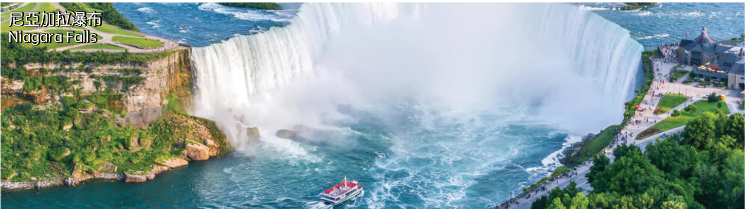
尼亞加拉瀑布 Niagara Falls

豪華酒店: Crowne(或Ramada) Plaza/Sheraton/Hilton /Courtyard by Marriott 或同級