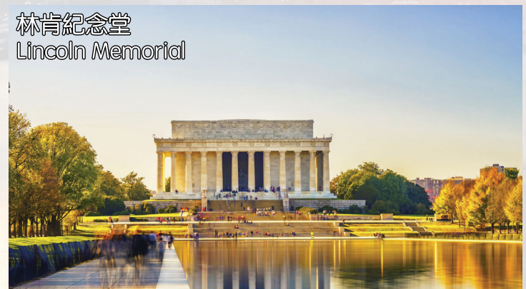
林肯紀念堂 Lincoln Memorial