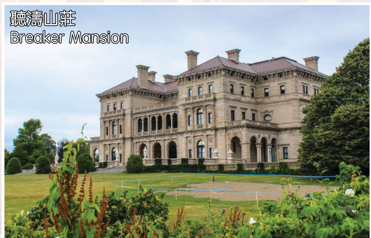
聽濤山莊 Breaker Mansion