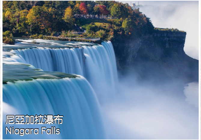
尼亞加拉瀑布 Niagara Falls

酒店: Salvatore's Garden Place Hotel (Buffalo Airport Area) 或同級