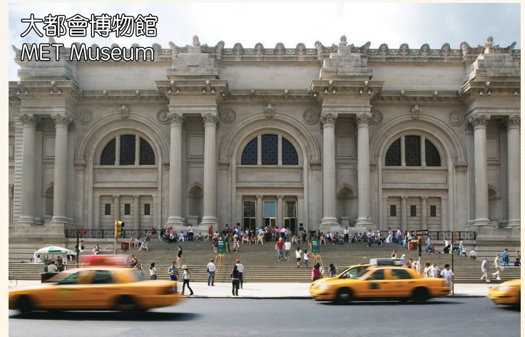
大都會博物館 MET Museum

酒店: Sheraton Edison/Hilton East Brunswick/Doubletree by Hilton Somerset或同級希爾頓, 喜來登系列酒店