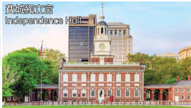
費城獨立宮 Independence Hall

酒店: Holiday Inn/Crowne Plaza/Shippen Place Hotel 或同級