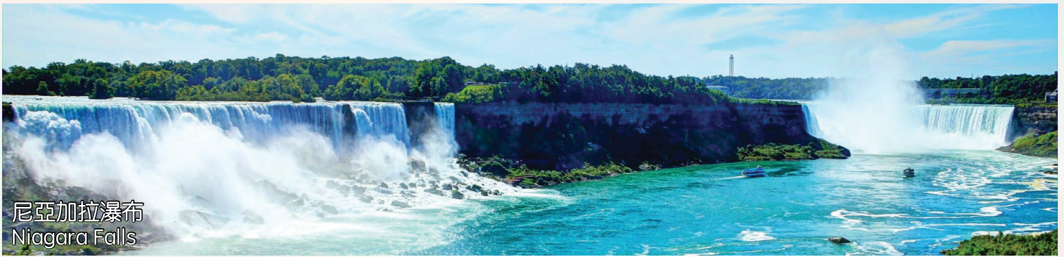
尼亞加拉瀑布 Niagara Falls