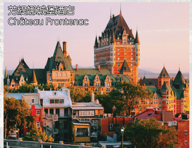
芳堤娜城堡酒店 Château Frontenac