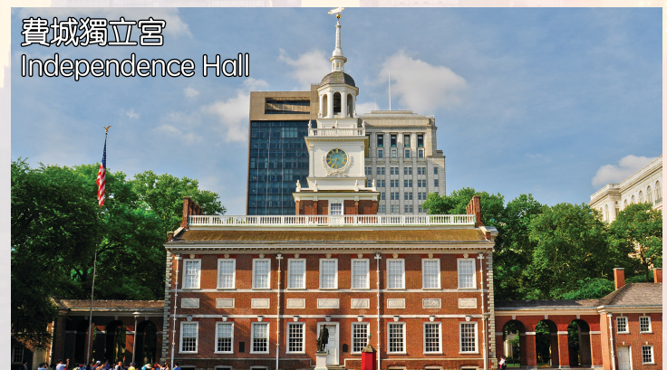
費城獨立宮 Independence Hall