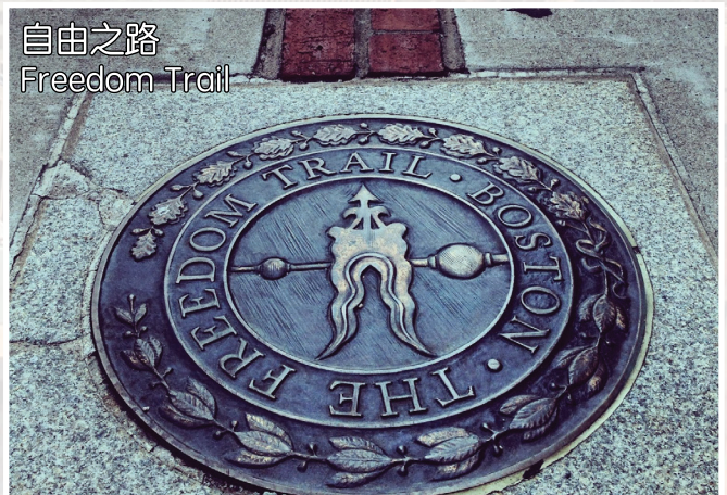
自由之路 Freedom Trail

Take Boston Walking Tour, we will walk through Boston Common, Park Street Church, Granary Burying Ground, Massachusetts State House, Old State House, Site of Boston Massacre, Faneuil Hall and so much more. If you prefer less walking sightseeing in Boston, you may choose to go for Boston Harbor Cruise with sightseeing of the city and visit the historical Quincy Market.