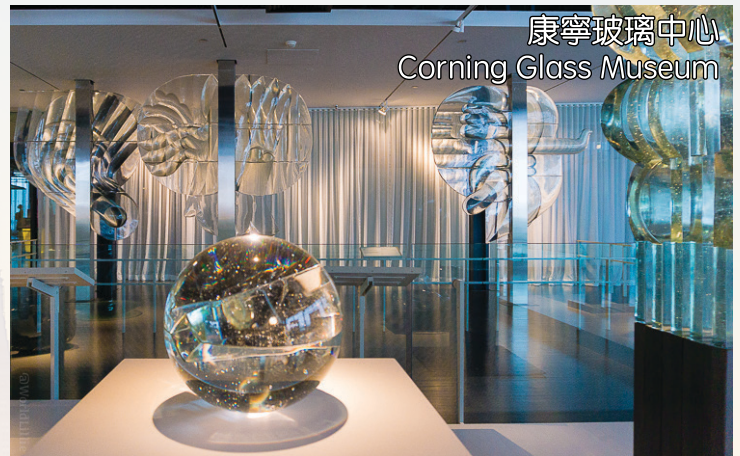
康寧玻璃中心 Corning Glass Museum