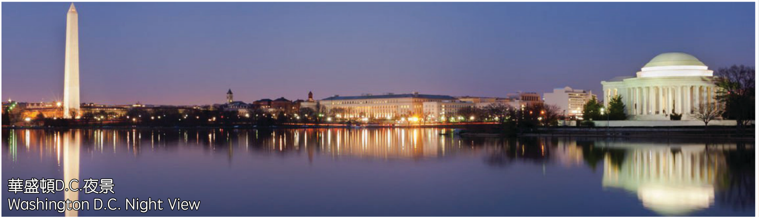
華盛頓D.C.夜景 Washington D.C. Night View