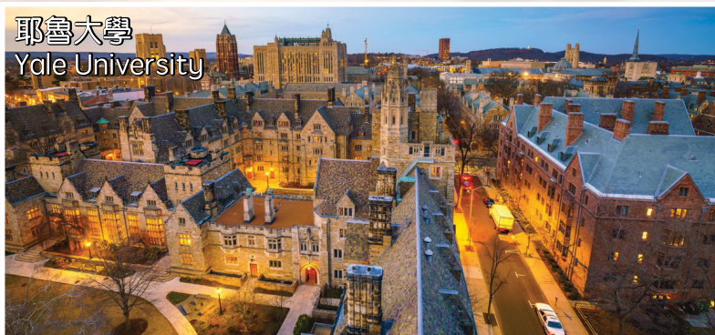
耶魯大學 Yale University